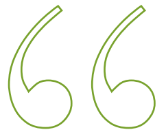
Corinne Gabriel, Studienbetreuung

” Im Mittelpunkt unseres Handelns steht der Studierende mit seinen individuellen Wünschen, Zielen und Anforderungen. “